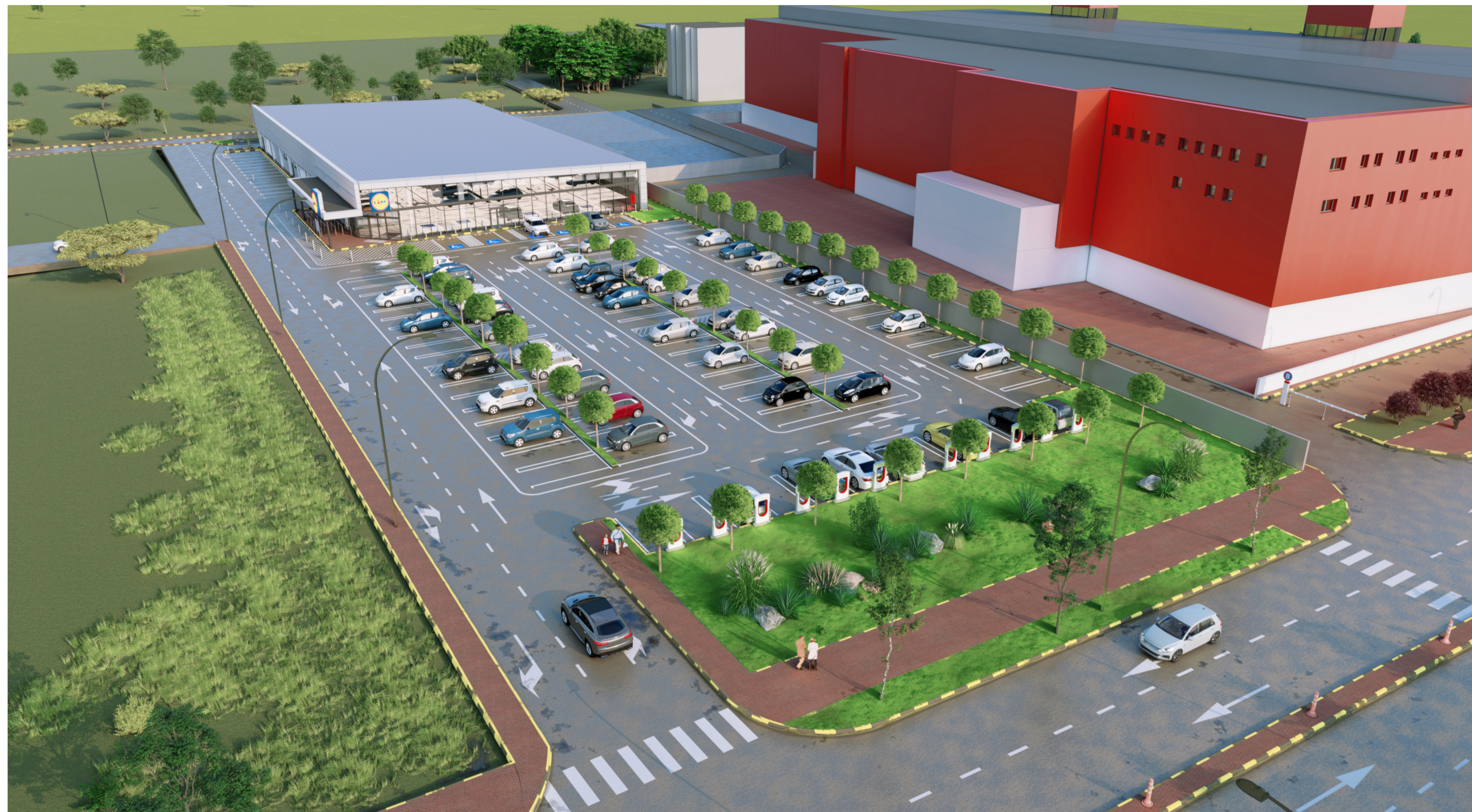
VEDERE AERIANA - BULEVARDUL 1 DECEMBRIE 1918 - ACCES AUTO SI PIETONAL