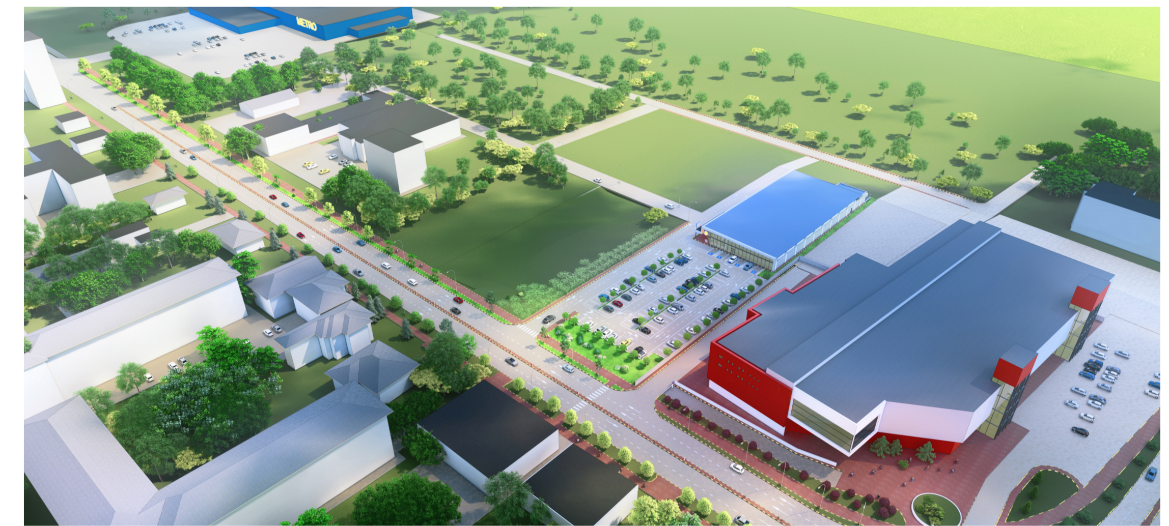
VEDERE AERIANA DE ANSAMBLU - BULEVARD 1 DECEMBRIE 1918