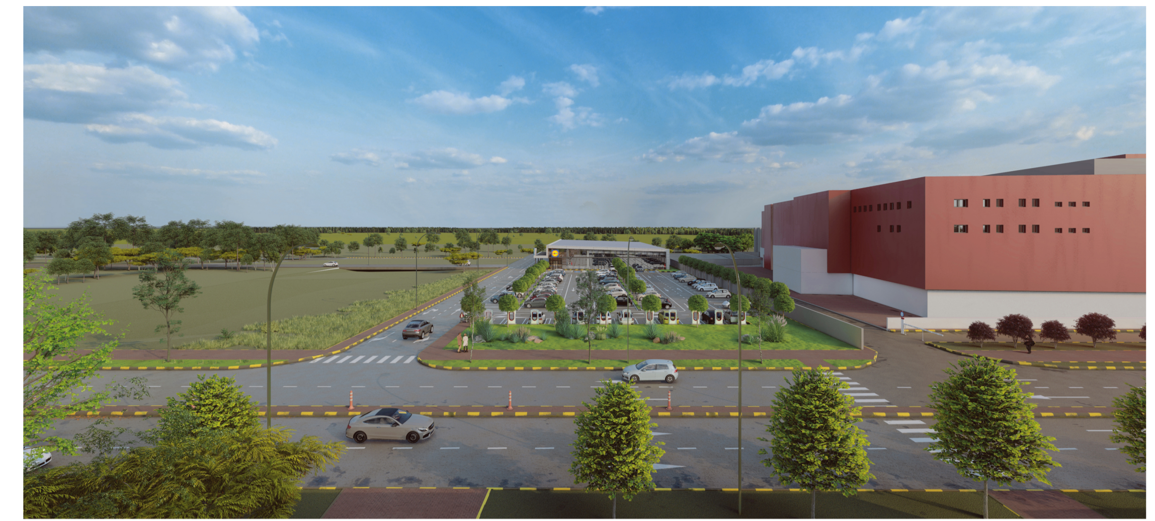
VEDERE AERIANA - ACCES AUTO SI PIETONAL