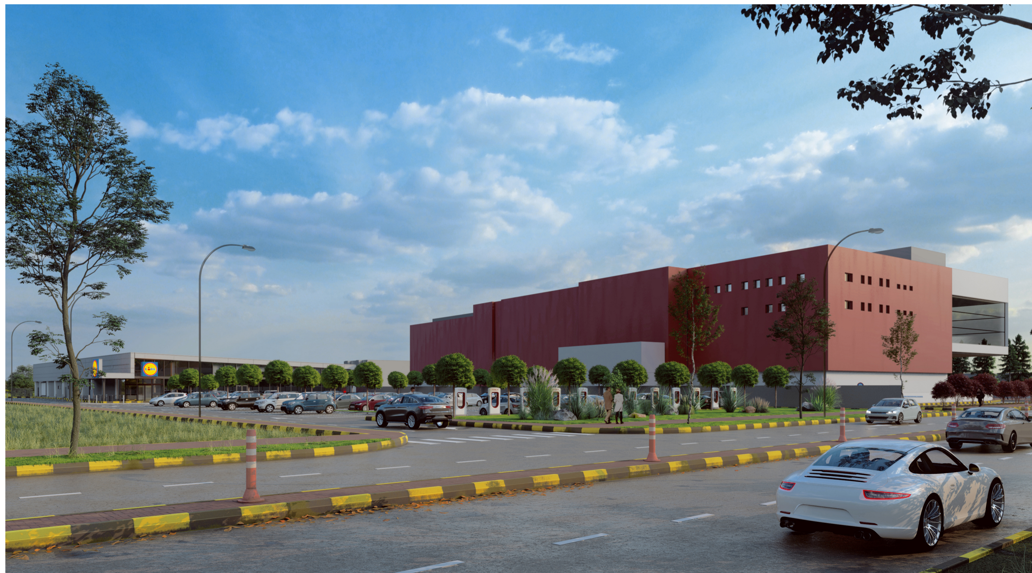
PERSPECTIVA - BULEVARDUL 1 DECEMBRIE 1918 - ACCES AUTO SI PIETONAL